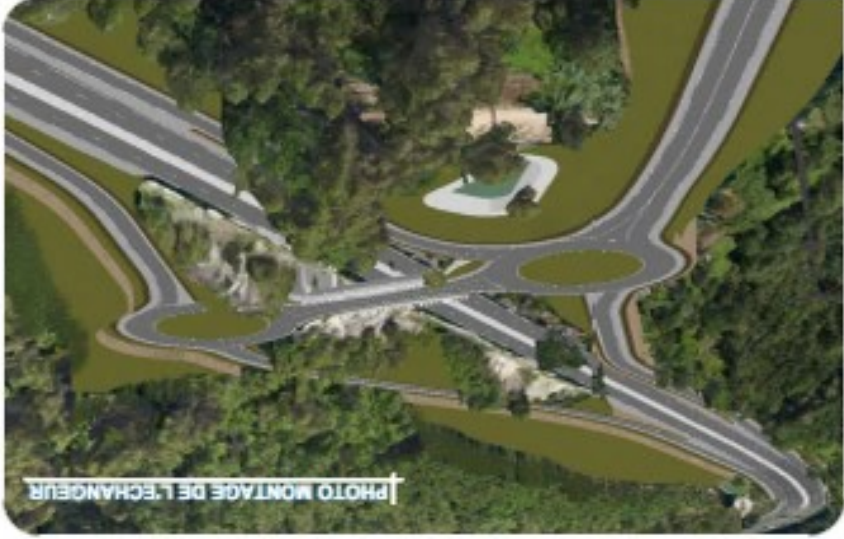
PHOTO MONTAGE DE L'ECHANGEUR