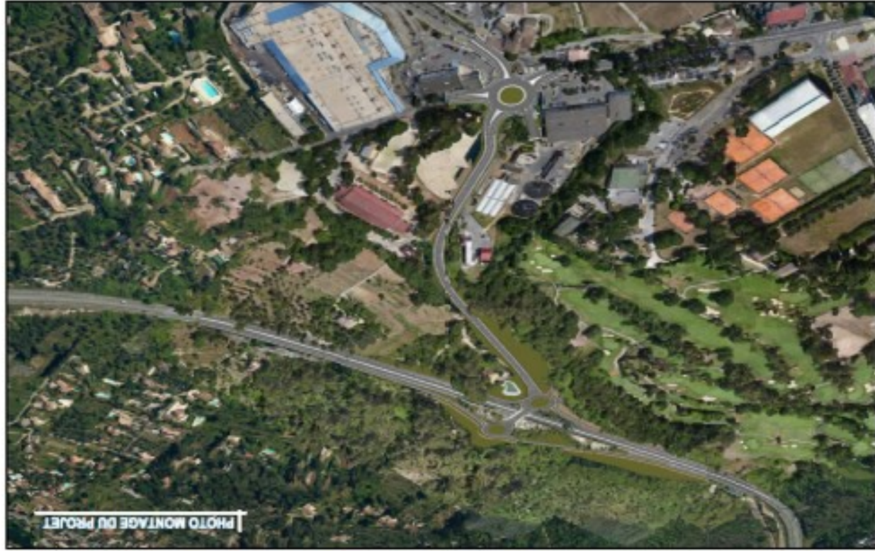
PHOTO MONTAGE DU PROJET