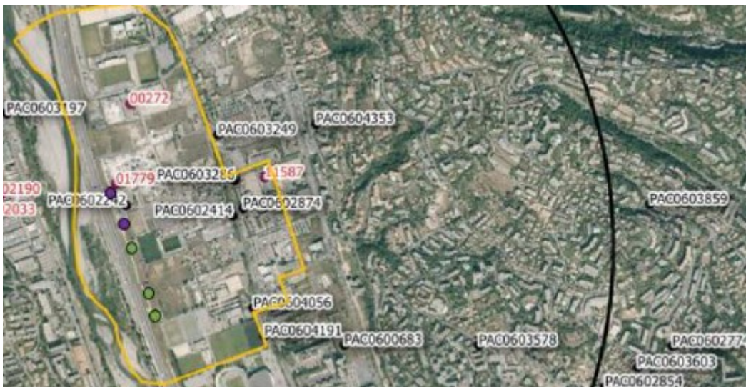
Figure 4: localisation des sites Basias (numérotation en noir) et ICPE (numérotation en rouge).

Sur le linéaire du fleuve, l'alimentation de la nappe alluviale du Var est essentiellement liée au fleuve, à un apport des calcaires jurassiques, et en plus faible proportion aux précipitations. Au niveau du projet, ces échanges se font de la nappe vers le Var hors pompage. Le champ captant est notamment alimenté par la partie est de la nappe alluviale, où sont concentrées des activités (sites Basias 6 et ICPE 7 ) potentiellement génératrices de pollution. Pour la MRAe, l'implantation d'une station d'alerte à l'est du champ captant est nécessaire, pour prévenir les risques de pollution.