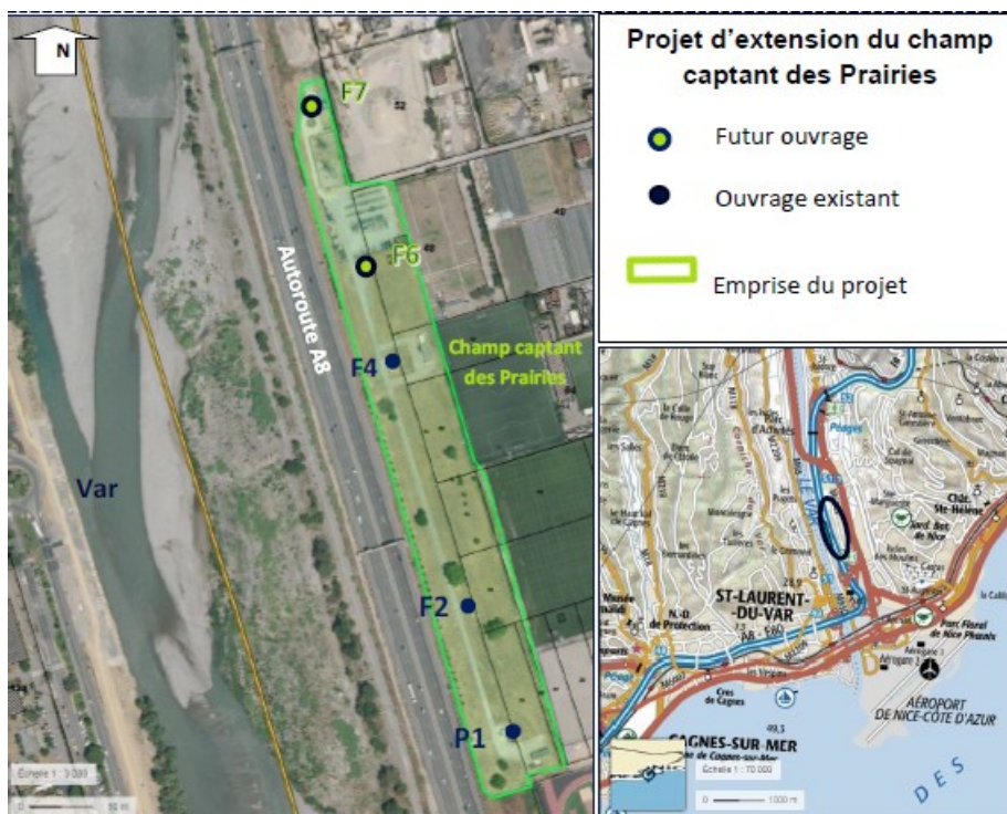
Figure 2: localisation du champ captant des Prairies et des ouvrages existants (en bleu foncé) et futurs (en vert).

Le champ captant des Prairies est situé sur la commune de Nice, en rive gauche du Var, dans le secteur de Lingostière. Il est aujourd'hui composé de trois ouvrages : un puits à drains rayonnants P1 et deux forages F2 et F4. Le projet prévoit l'extension de ce champ captant existant par la réalisation de deux nouveaux forages F6 et F7, afin de porter le débit prélevé de 650 l/s à 950 l/s. La date prévisionnelle de la mise en service de ces ouvrages est le mois de mars 2021.