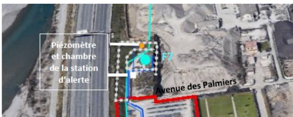
Figure 3: Localisation du piézomètre de surveillance (point orange).

Le dossier prévoit d'implanter une station d'alerte (piézomètre 5 de surveillance) en amont immédiat du forage F7. Cette trop grande proximité entre le piézomètre et le forage ne permet pas de garantir un temps de réactivité suffisant pour agir dans le cas d'une pollution du Var.