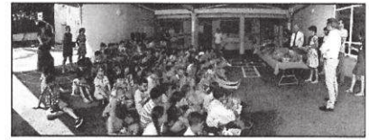
Un parent d'élève travaille chez SAP Labs et vient régulièrement à l'école pour initier les enfants au codage informatique.