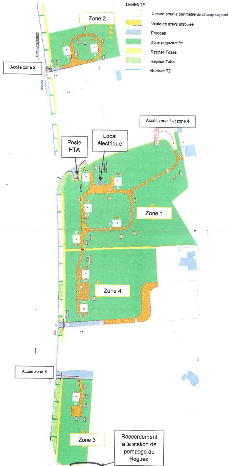
Figure 9 : Configuration future du champ captant du Roguez