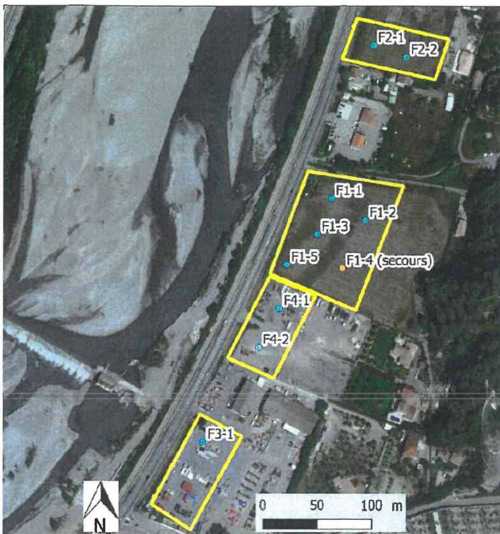
Carte 4 : Emprises prévisionnelles des ouvrages de prélèvement (forages)

La zone d'emprise définie en phase de faisabilité est représentée ci-dessous :