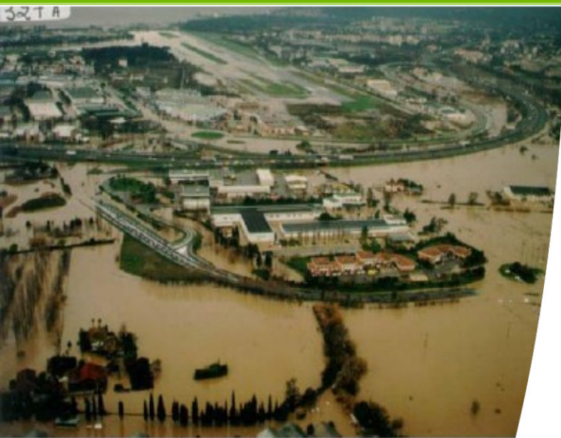
Inondation de 1996 – échangeur 41

Réunion du vendredi 14 septembre 2012 Démarche de spatialisation des secteurs urbains constitués