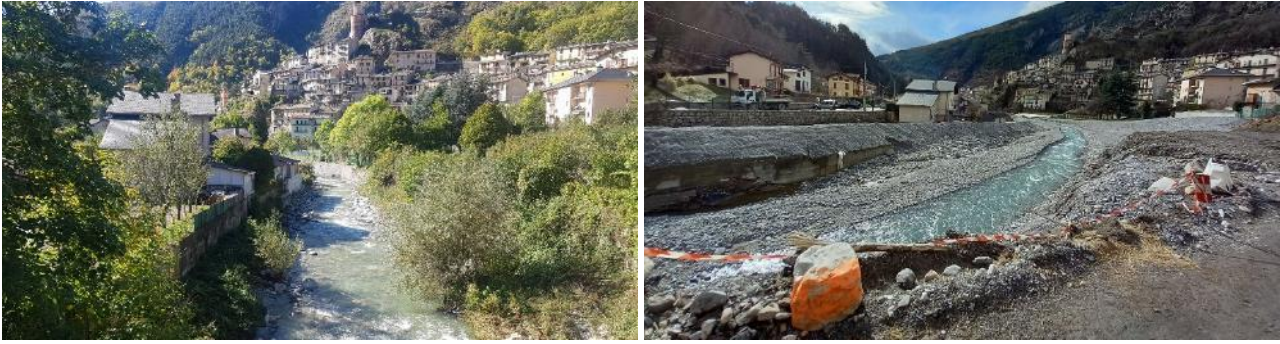
Figure 1: Avant-Après, vue depuis le pont des Truites