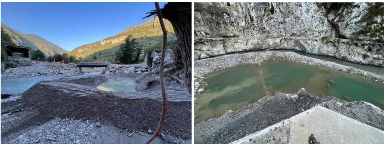
Figure 3-Principe de chenal de filtration, chantiers de la Roya

Les dispositifs d'isolement de la zone de chantier auront un rôle de fusible en cas de crues.