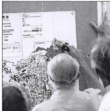
L'enquête publique sur la révision du PPRI sera effective au printemps 2020.

Les remarques et observations vont désormais nourrir le projet de PPRI qui va être mis à jour. L'ensemble des courriers et courriels vont faire l'objet d'une réponse dans le bilan de la concertation qui sera an-