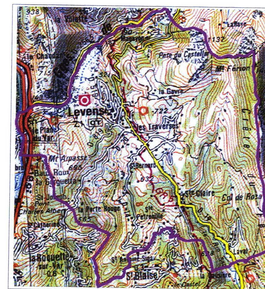
Carte des Aléas