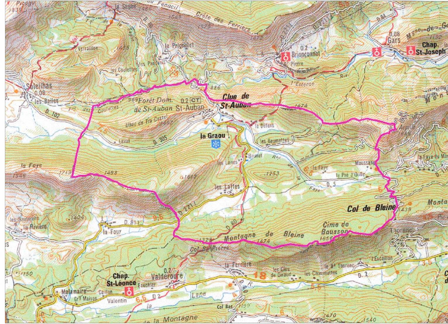
Carte des bassins versants