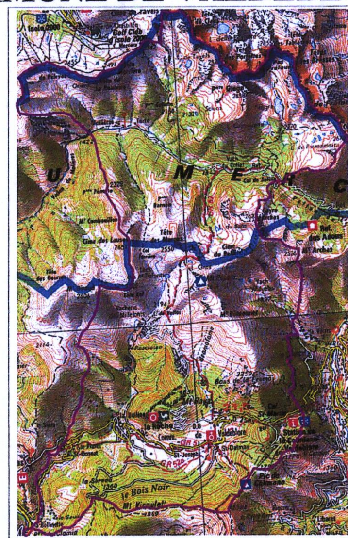
Carte des aléas torrentiels