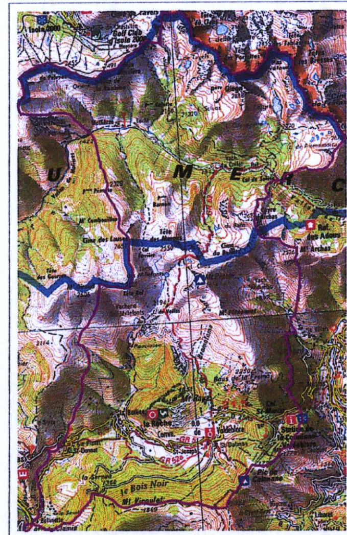
Carte des aléas Mouvements de terrain