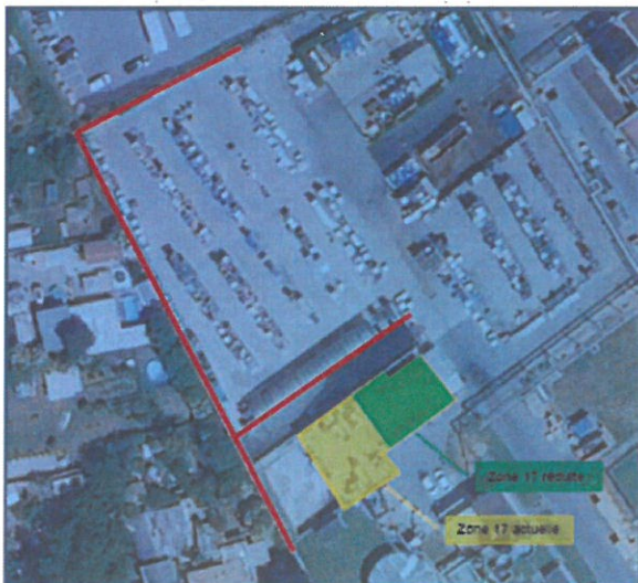
Positionnement des murs REI120 de 4 m de hauteur proposés par Bureau Veritas et réduction de la surface de stockage de la zone 17